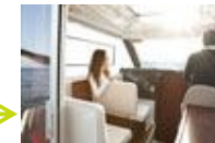
Sitze in Fahrtrichtung